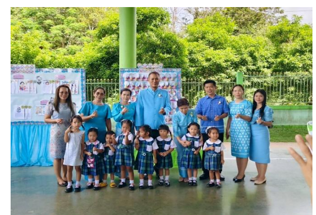
การติดตามและประเมินผลแผนพัฒนาองค์การบริหารส่วนตำบลห้วยโจด ประจำปีงบประมาณ พ.ศ.๒๕๖๘ ตำบลห้วยโจด อำเภอวิวัฒนาการ จังหวัดสระแก้ว