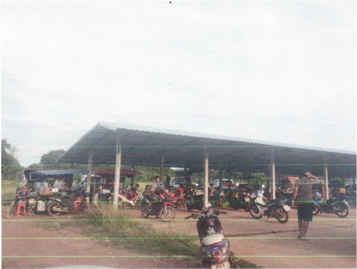
ตลาดนัด หมู่ 3 บ้านคลองยาง